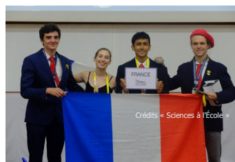
La délégation française 2018 en stage de terrain (à gauche) et aux 12 e IESO en Thaïlande (à droite).