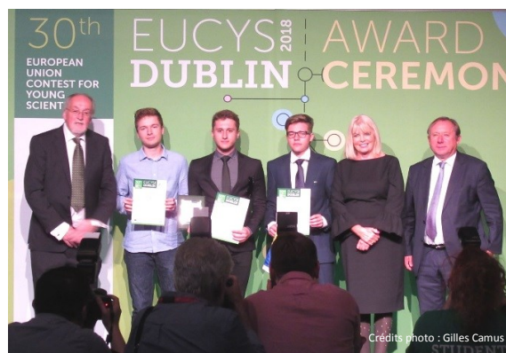
Remise du 2 ème prix de la commission européenne