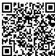
Les outils de création de Quizinière

→ Visualiser la vidéo présentant les outils de création de Quizinière en scannant le QR Code ou bien à l'aide de l'hyperlien :